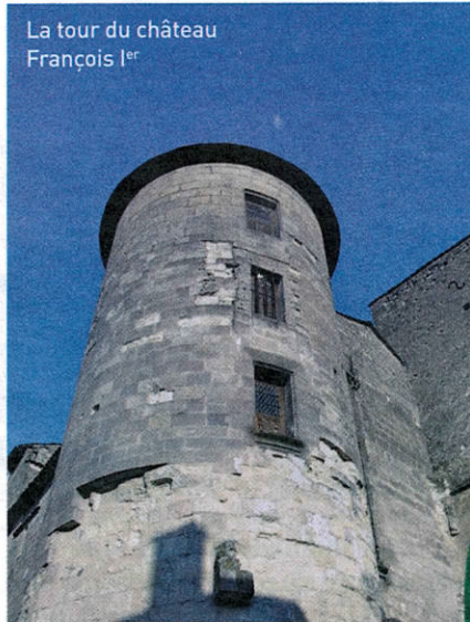
La tour du château François I er

► ganise autour de trois pôles, le port saunier, le château et le prieuré Saint-Léger. Trois pôles comme trois puissances : celle de l'Église, celle des marchands et celle du seigneur. L'église Saint-Léger est étonnante, car elle surgit au milieu de bâtisses collées sur son flanc. Il faut contourner ces maisons pour découvrir la magnifique façade au portail ouvragé, de pur style roman saintongeais, percée ultérieurement d'une rosace gothique au XV e siècle.